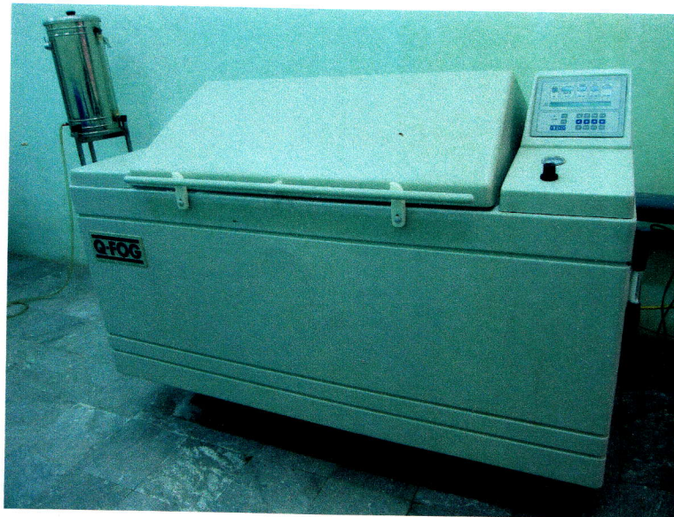
Thiết bị phun mù muối: Q-FOG Cyclic Corrosion Tester CCT 600

Quan sát bề mặt: Quan sát bằng mắt thường